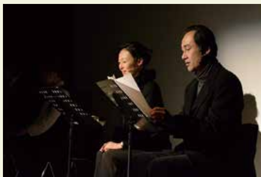
キャストの迫真の朗読に引き込まれました (於：音楽座ミュージカル芹ヶ谷スタジオ)

もたちや市民がほとんどで、演技・歌・ストーリーの素晴らしさに感動している様子が多く見られました。グループディスカッションの最後には劇中歌を全員で合唱し、会場全体が一体感に包まれたイベントとなりました。