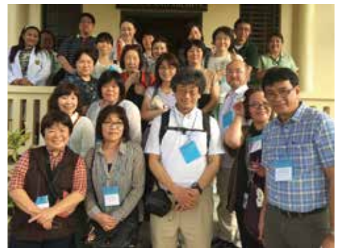
セブ島エバースレイ・チャイルズ療養所資料館前で

この「あたりまえ」という感覚は知らないうちに誰かを差別してしまう凶器になる、差別やスティグマはもしかしたら身近にあるのかもしれない、と自己を見つめ直すきっかけにもなりました。今回の研修を終え、生命の尊厳とは何かを学び続けながら、その人らしく生きていけるための支援である看護を実践していかなばと決意しました。また、この経験を次世代に引き継いでいこうと思います。