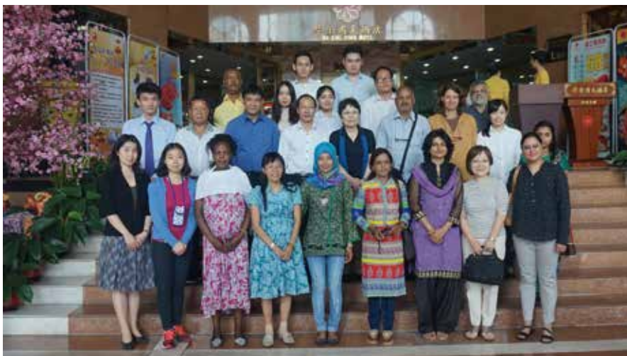
会場、華金盾大酒店 (Wa King Town Hotel) のロビーで集合写真

2日目の午後、6名の回復者は広州市内のハンセン病定着村を訪問し、中国の回復者との交流を持ちました。一方、TEGメンバーは、今回の回復者からの聞き取りと議論を通じて得られたことを元にした事例収集を含み、今後の作業計画を検討しました。本TEGの作業による成果物は、2016年9月に中国で開催予定の、第19回世界ハンセン病会議で発表と報告をする予定です。