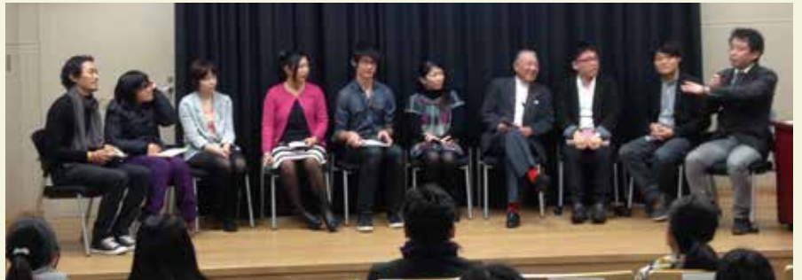
日本財団笹川陽平会長と並んで学生たちもハンセン病問題を考えました (ハンセン病でつながる若者シンポジウム 於：早稲田大学)

一般公募で集まったサイドイベント23件は、北は宮城から南は沖縄まで全国各地で開催され、参加者総数は2,500名超に及びました。特筆すべきは、今までほとんどハンセン病と関わることのなかった学生や市民を対象とした企画が多かったことです。今回の一般公募によって、これまでほとんど当財団と接触がなかった人々や地域にアプローチできたことも大きな喜びの一つでした。中には大きく新聞等で取り上げ