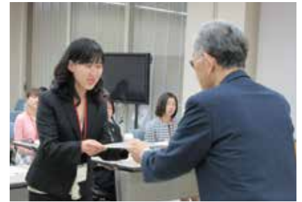
決定通知授与の様子

人材育成事業では、ホスピス緩和ケアの専門性を学ぶため、4名の医師が各施設で研修を行います。また、看護師の国内外の大学院進学への支援を通し国内の緩和ケアの