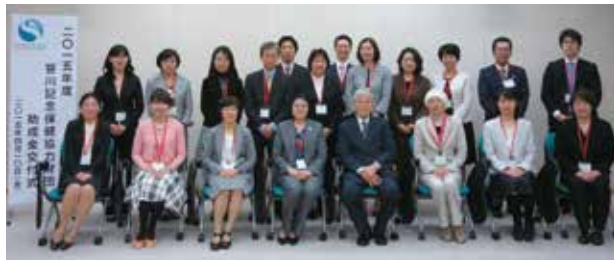
交付式参加者の写真

それぞれの進学先で学んでいます。交付式にて決定通知の授与後、各助成事業の事務手続き説明会と助成者同志の交流を目的とした懇親会を開催しました。助成者は、1年後の「助成者報告会」にて、それぞれの研究・研修成果を報告する予定です。